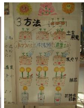
課題研究ポスター発表のようす