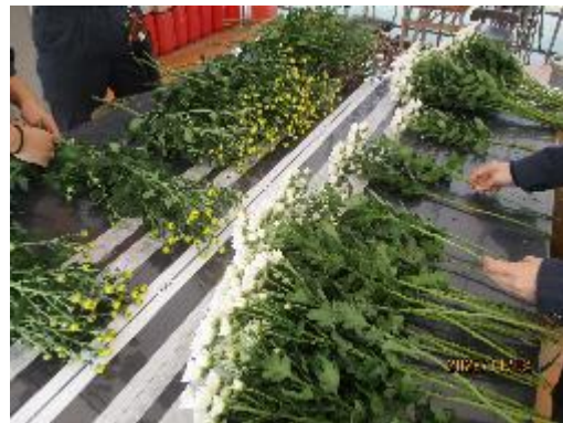
秋ギクを販売しました